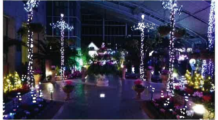
ふららイルミネーション

夜間営業 - 4/28 (土) ~ 5/6 (日) イルミネーション点灯時間 - 午後 6 時 ~ 8 時