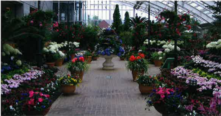
ふららスプリングガーデン